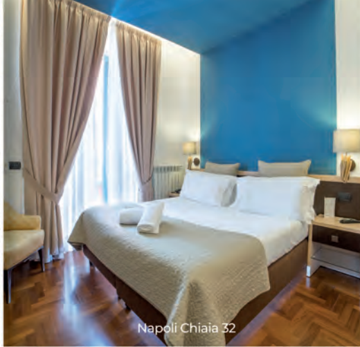
Napoli Chiaia 32