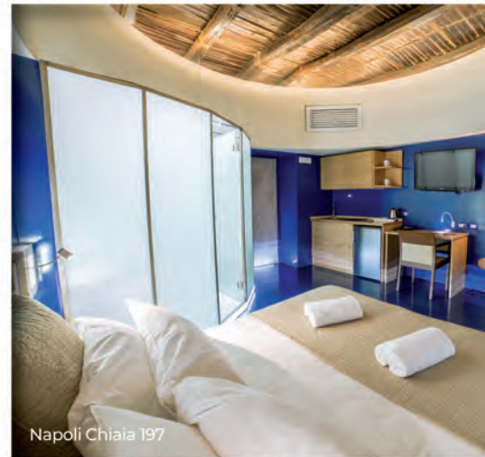
Napoli Chiaia 197