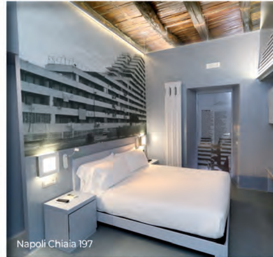
Napoli Chiaia 197

Nelle nostre strutture ricettive diffuse tra l'Umbria e la Campania sono racchiuse la storica passione per il turismo ed il tradizionale stile italiano