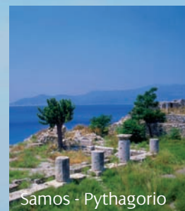
Samos - Pythagorio

È il luogo di nascita del filosofo e matematico greco Pitagora, il filosofo Epicuro, e l'astronomo Aristarco di Samo, il primo a proporre la teoria della terra che gira intorno al sole. Seguendo le loro orme si possono visitare numerosi siti archeologici – la Heraion di Samo è un monumento di World Heritage –, antichi monasteri e chiese, e partecipare agli eventi culturali e festival musicali. Samos è un'isola estremamente ricca di vegetazione, con spiagge di sabbia bianca e villaggi tradizionali. L'isola è nota anche per il 'samiótiko Krassi', il vino dolce di Samos.