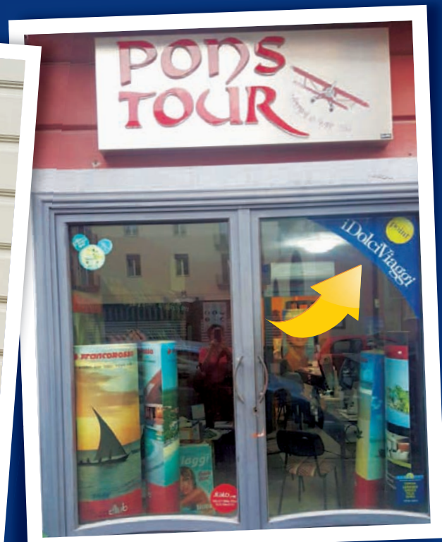
Pons Tour di Napoli