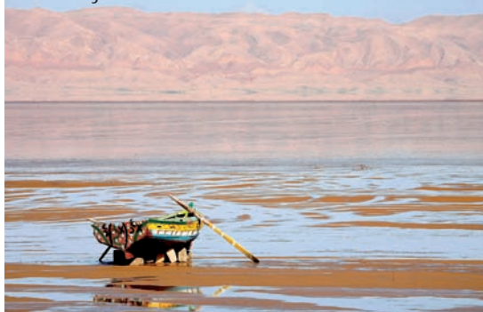
Chot el Jerid