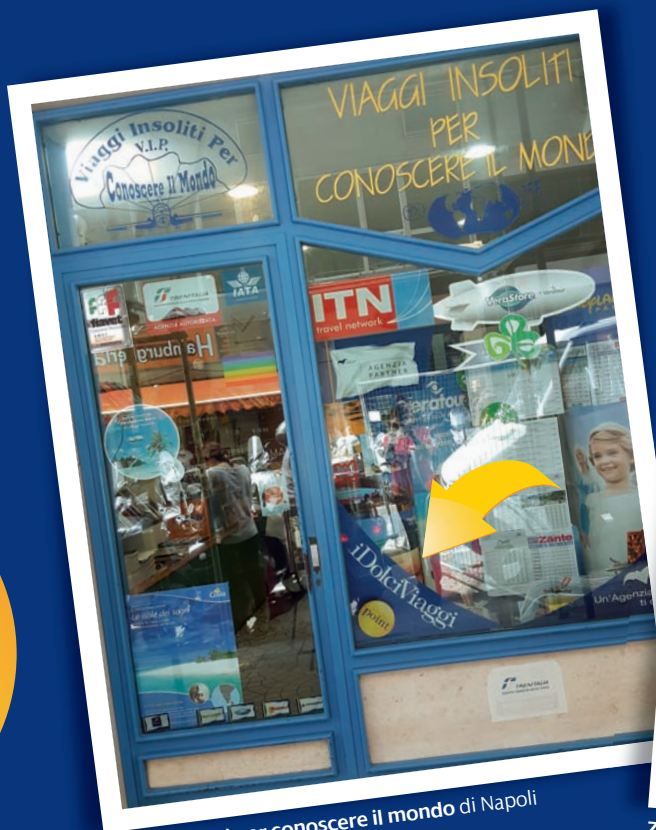
Viaggi insoliti per conoscere il mondo di Napoli