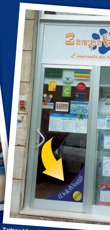
Zampa Viaggi di Napoli