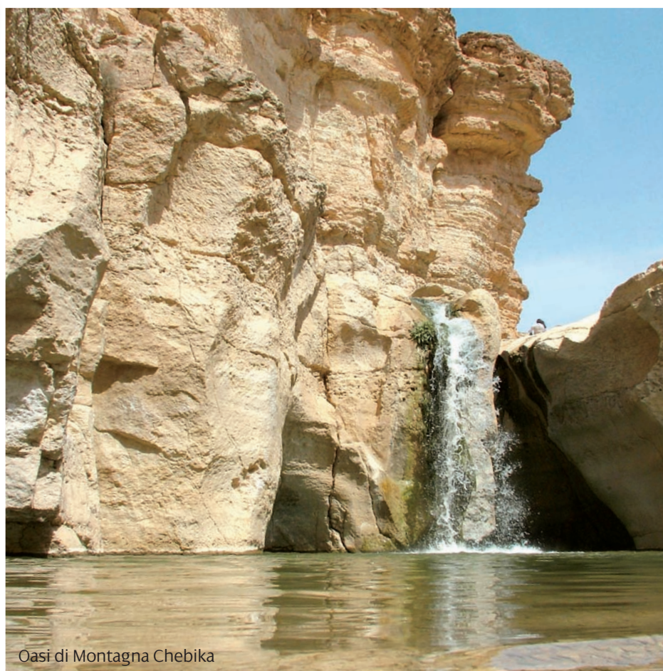
Oasi di Montagna Chebika

Nel suo impegno di diversificare la propria offerta, la Tunisia ha compiuto un ulteriore passo avanti per rispondere alle nuove esigenze emergenti dei visitatori, oggi più che mai alla ricerca di 'hotel di