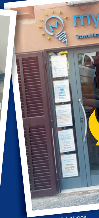
Mydea Travel di Napoli