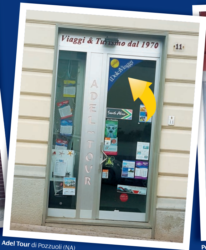
Adel Tour di Pozzuoli (NA)