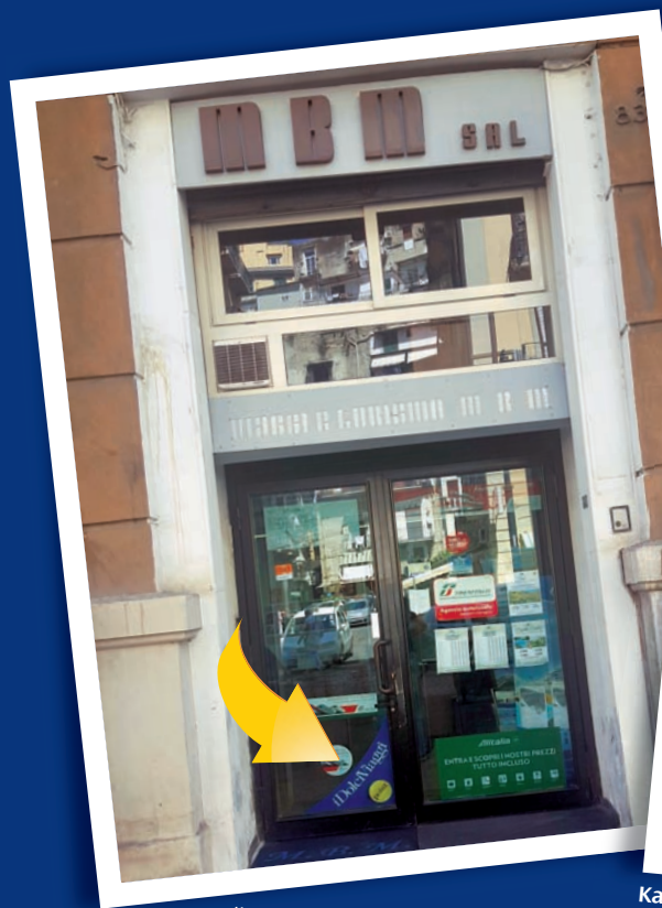
Mbm di Napoli