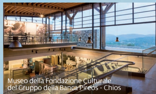
Museo della Fondazione Culturale del Gruppo della Banca Pireos - Chios

Già conosciuta come il 'Mastic Island', l'isola ospita il famoso Mastihohória, una serie di villaggi fortificati costruiti nel 14° secolo durante la dominazione genovese. Tra di loro, Mesta è un tesoro medievale con torri conservato castello, antiche chiese e case di pietra magnifico strettamente unite insieme con archi. Qui si possono gustare deliziosi piatti cucinati con la masticca e assaggiare un sorso