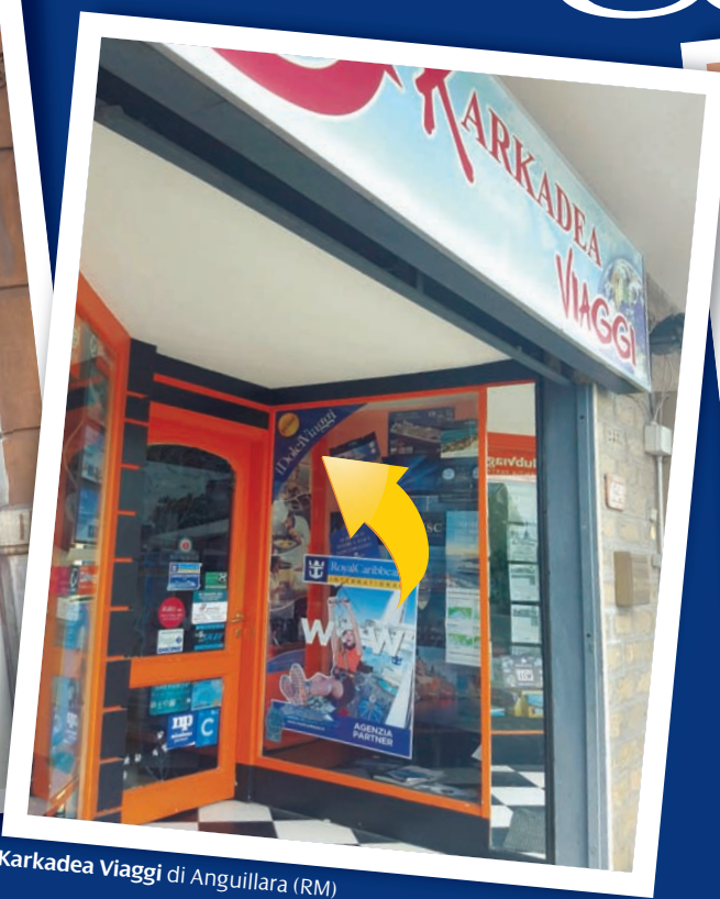
Karkadea Viaggi di Anguillara (RM)